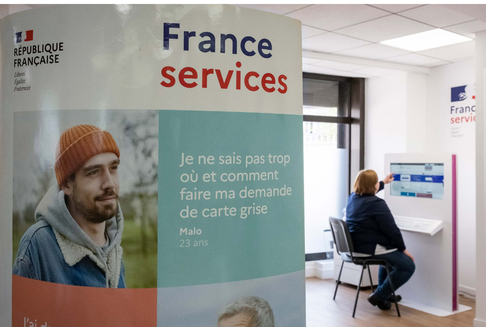
La maison France services d'Alfortville dans le Val-de-Marne (94).

Avec désormais plus de 2 750 maisons France services ouvertes sur le territoire, chaque Français dispose d'un accompagnement de proximité et de qualité à moins de 20 minutes de chez lui.